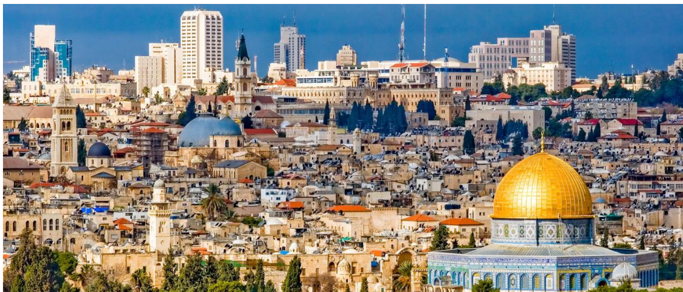
Jerusalém - Israel