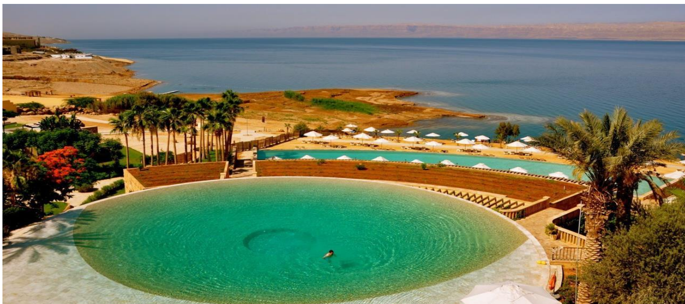
Mar Morto - Israel